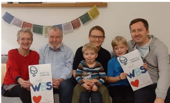
Unser „Danke-Foto“ für die WBS-Gruppe (mit Fähnchen aus Nepal im Hintergrund)

Das Plan Wirkungsarchiv listet alle erfolgreich abgeschlossenen Projekte auf.