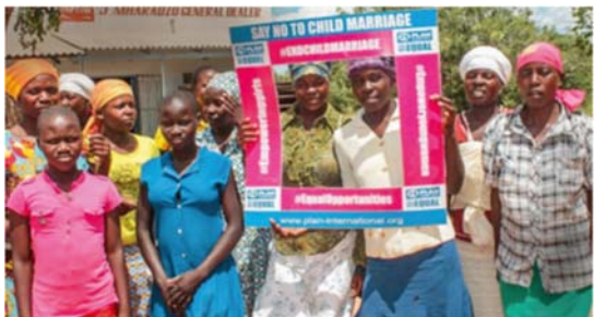
Projekt-Ausblick Simbabwe: Um „Say no to child marriage“ geht es im neuen Projekt