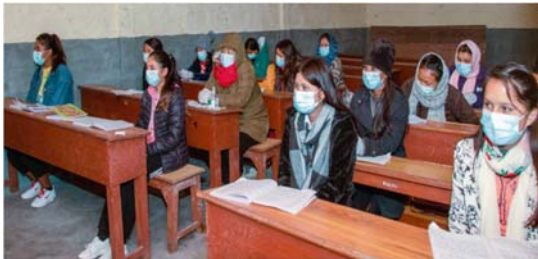
Lernen unter Corona-Bedingungen in unserem Nepal-Projekt