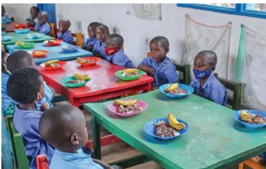
Schulspeisung gehört natürlich mit zum Programm des Ruanda-Projekts