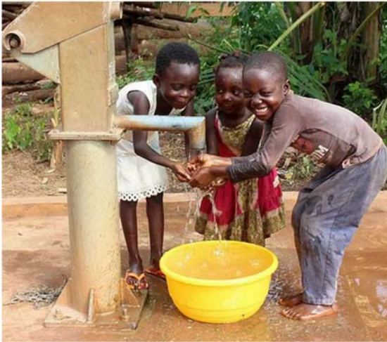
Plan-Brunnen in Ghana