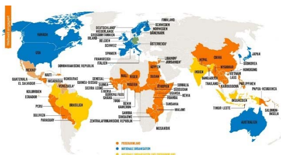
PLAN Projekt-Länder (in orange & gelb)