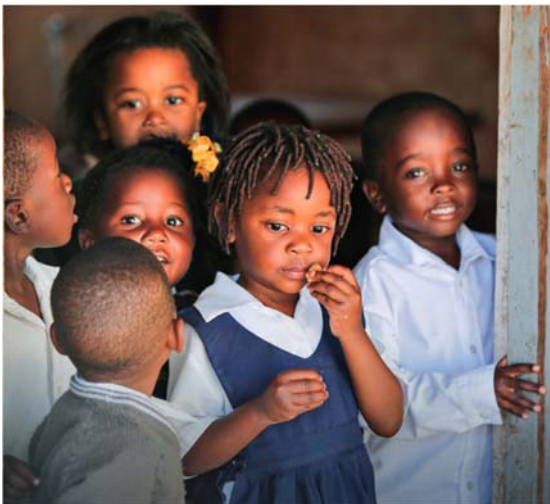
Schulkinder in Malawi