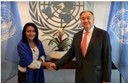
Ausschnitt Girls' Rights Wins 2017