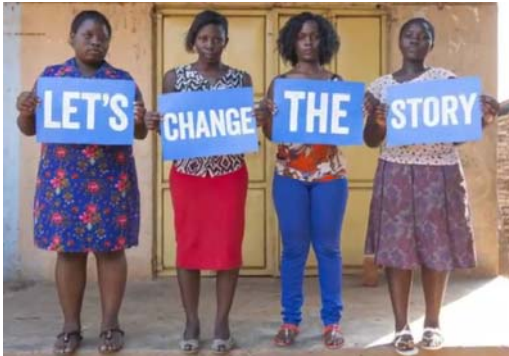
Ausschnitt Girls' Rights Wins 2017

2017 HAS SEEN SOME MOMENTOUS GIRLS' RIGHTS WINS