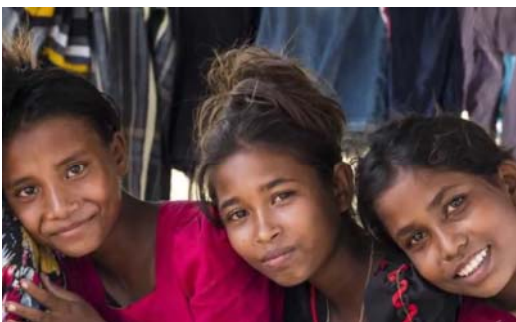
Ausschnitt Girls' Rights Wins 2017

IN AUGUST, JORDAN ABOLISHED ITS 'RAPE LAW'