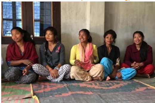
Treffen einer Lerngruppe in Nepal