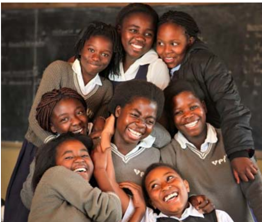
Stipendiatinnen in Malawi