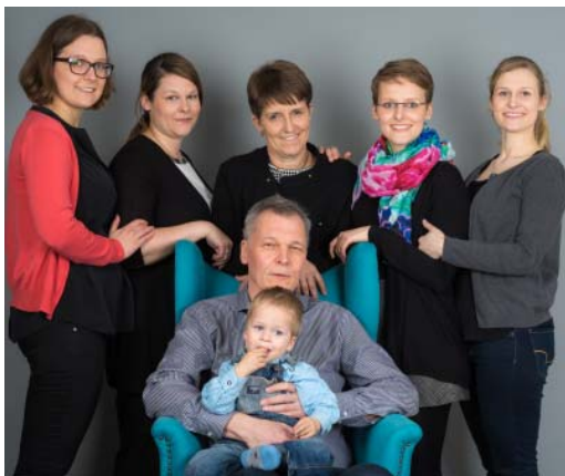
Familie Loczenski