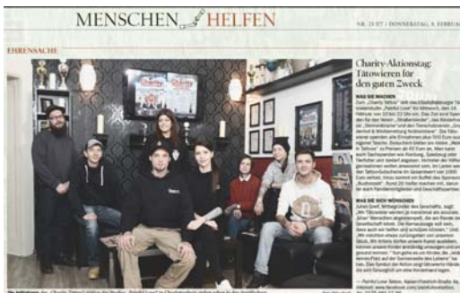
Charity Artikel